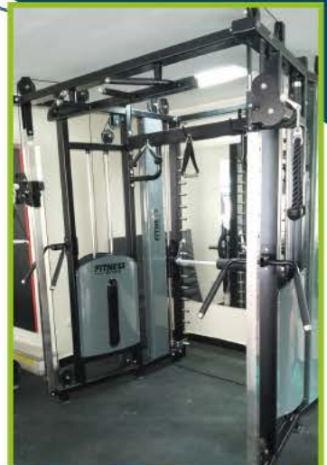
Moderna Jaula Multifuncional